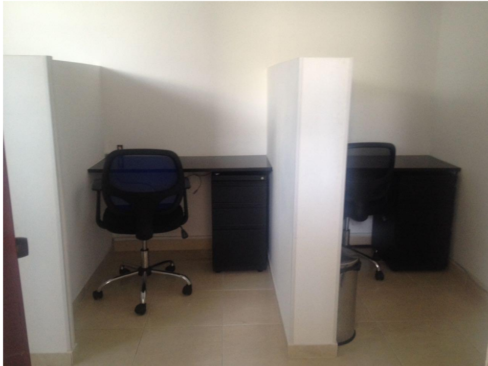
SALA DE JUNTAS