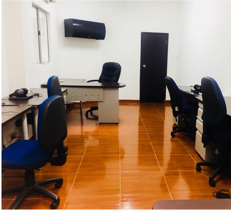
SALA DE JUNTAS