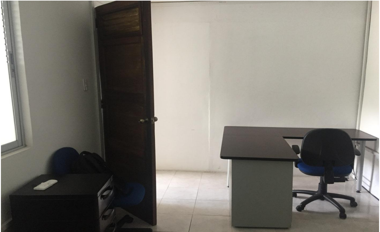
SALA DE JUNTAS