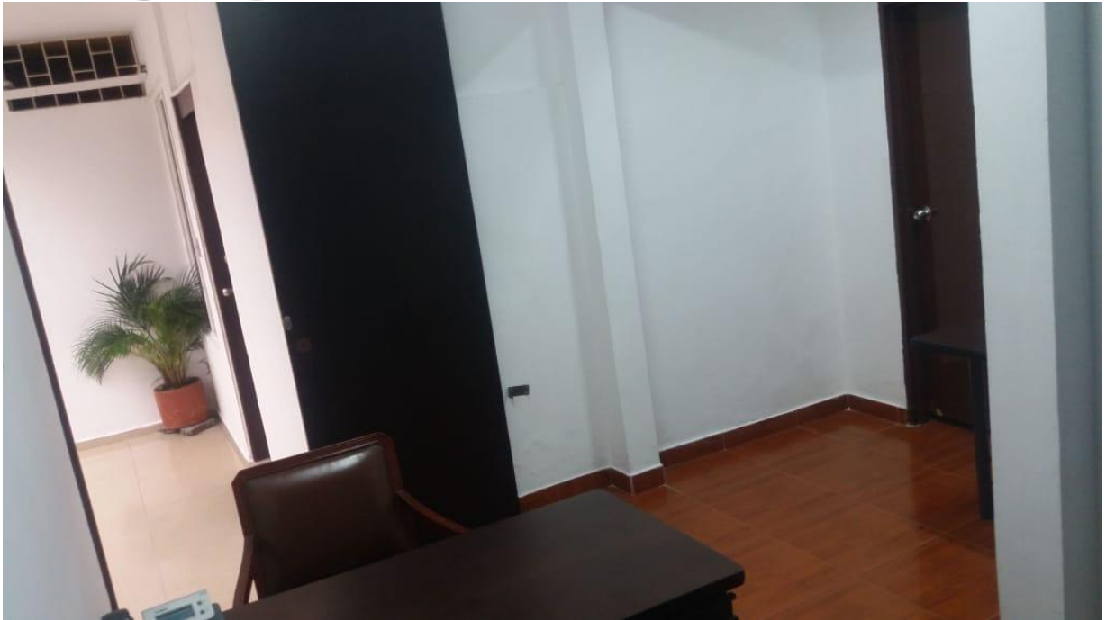
SALA DE JUNTAS