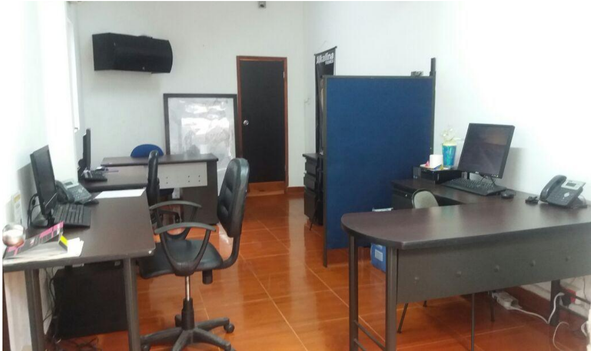
OFICINA FISICA POR HORAS