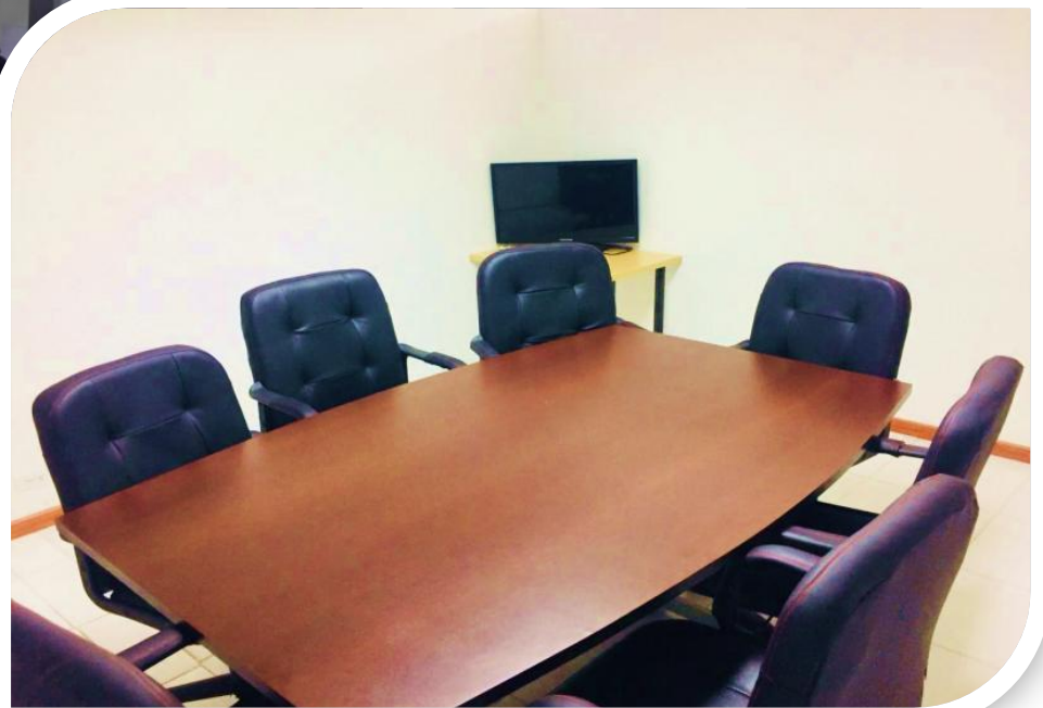
SALA DE JUNTAS